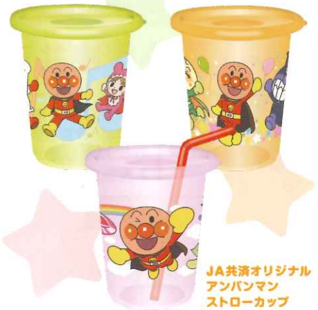
JA共済オリジナル アンパンマン ストローカップ

※数に限りがございますので、なくなり次第終了とさせていただきます。※賞品のデザイン・仕様等は変更となる場合がありますので、あらかじめご了承ください。